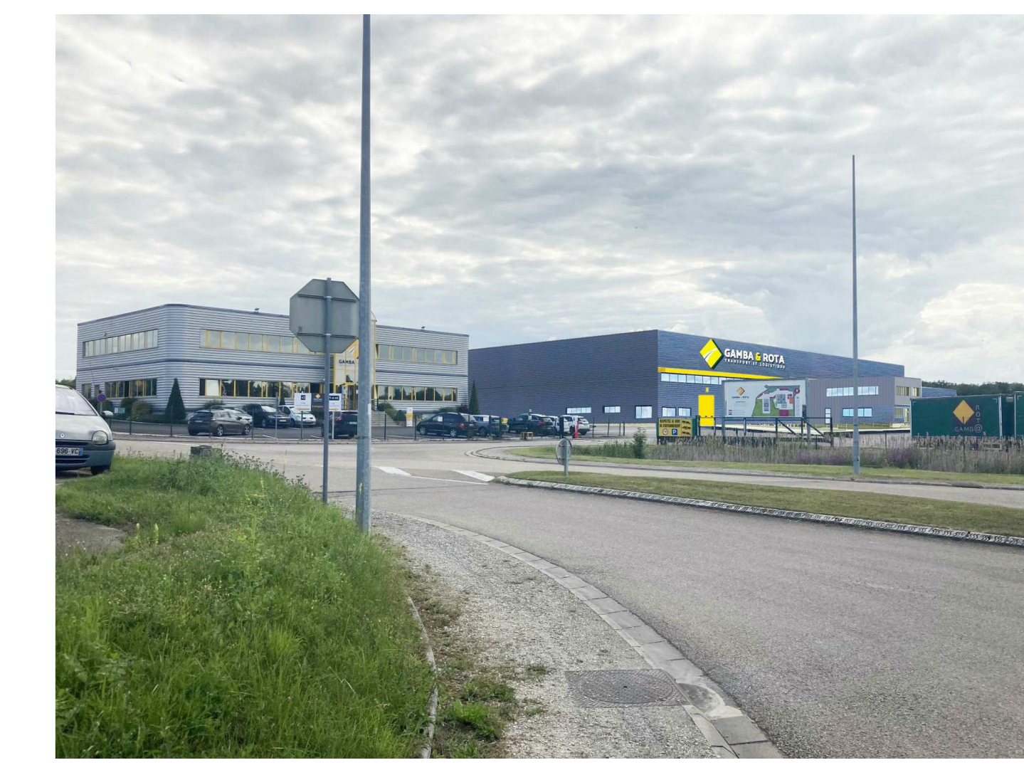
PC6 - Document graphique d'insertion dans le site